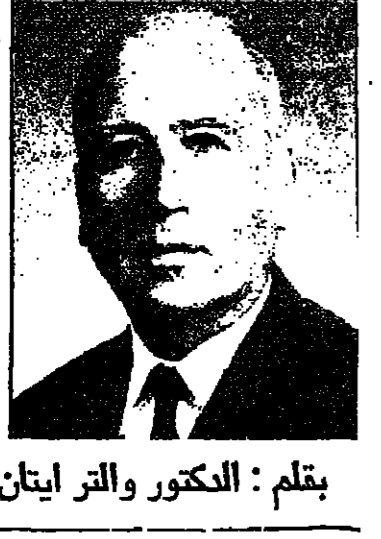
بقلم: الدكتور والتر ايتان

الزراعة من تحيين الآن انه رغم كل جهود كارتير، وماسكي فاتها لم يفلح في حل... «الاردن، وخالد ملك المملكة العربية السعودية...»